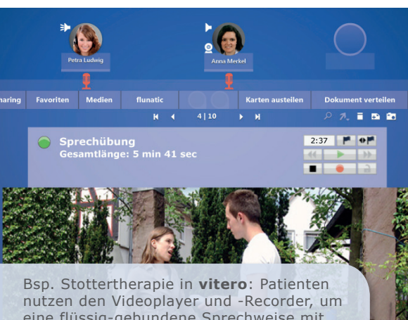
Bsp. Stottertherapie in vitero : Patienten nutzen den Videoplayer und -Recorder, um eine flüssig-gebundene Sprechweise mit Hilfe eines Therapeuten zu erreichen.

Die Kasseler Stottertherapie ist deutscher Marktführer im Bereich der Sprechtherapie. Sie führt erfolgreich Präsenz-Sprechtherapie an bundesweit sechs Standorten durch, virtuelle Gruppen-Stottertherapie mit vitero wird weltweit angeboten. Dabei kommt der virtuelle Therapieraum sowohl für komplette Online-Therapien als auch für Übungseinheiten